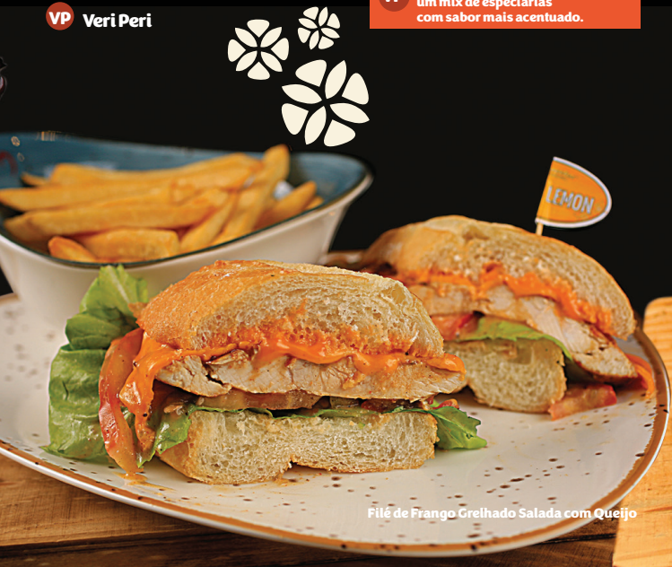
Filé de Frango Grelhado Salada com Queijo

VP Para quem gosta de pimenta, um mix de especiarias com sabor mais acentuado.