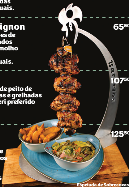
Espetada de Sobrecoxas

Espeto grande com medalhões de filé mignon marinados e grelhados na brasa com nosso premiado molho Prego e mini cebolas grelhadas + 2 acompanhamentos grandes.